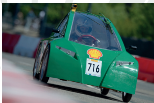
Véhicule de l'ENS Rennes lors du Shell Eco-marathon 2015