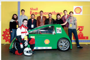
Équipe de l'ENS Rennes lors du Shell Eco-marathon 2015

* Présence permanente sur les différentes vidéos que nous réaliserons autour de notre participation ainsi qu'une communication de notre partenariat sur les différents médias de l'école.